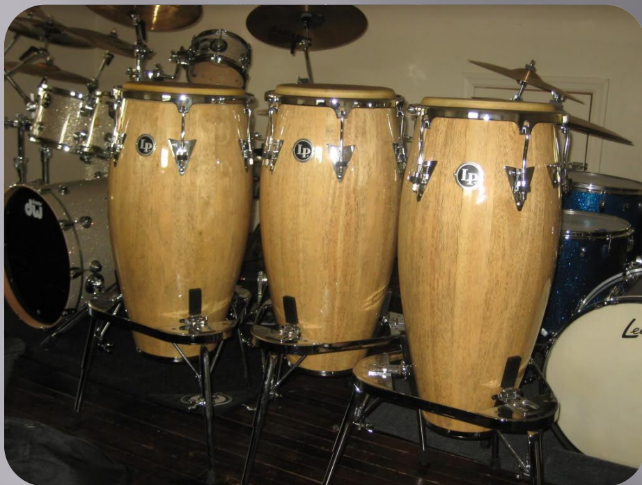
CONGAS LP MATADOR